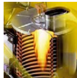
Vedenlämmittimen teho 74 kW