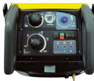
Lämpötilan säädin, kemikaalisäädin