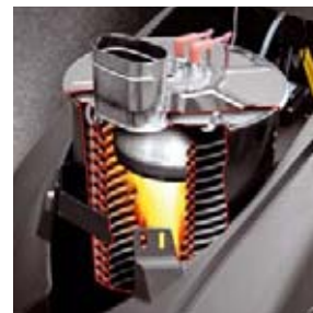
Vedenlämmittimen teho 88 kW